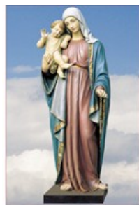
Marie, Reine de l'Amour (Saint Martin de Schio)