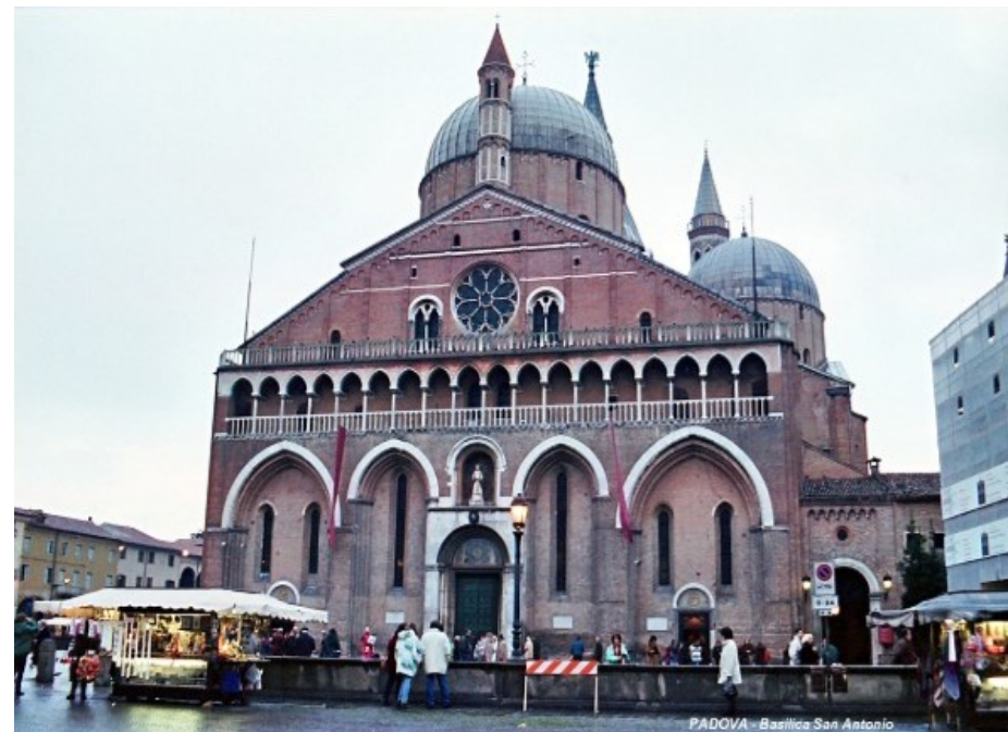
PADOVA - Basilica San Antonio